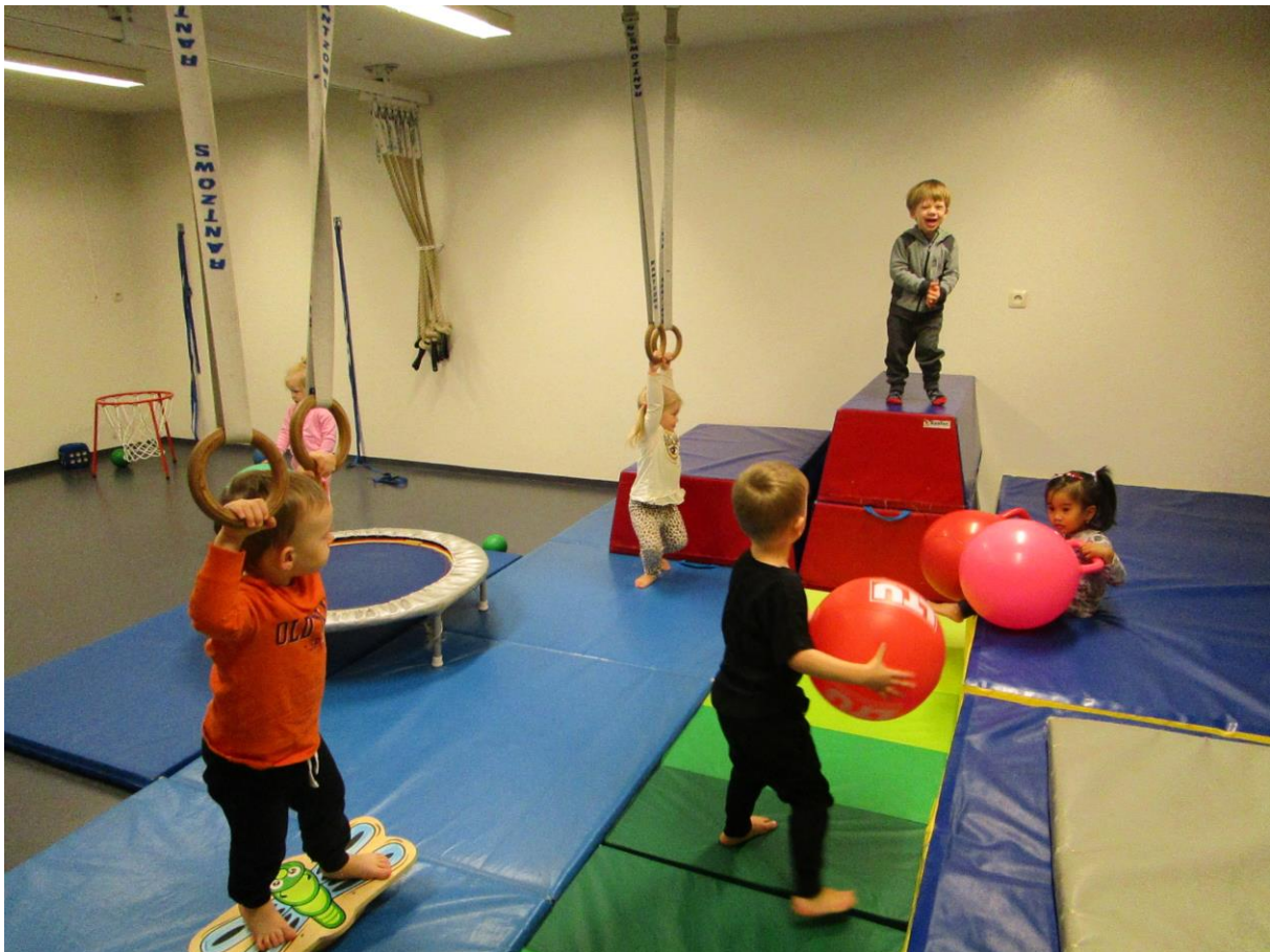
Hreyfistund í sal